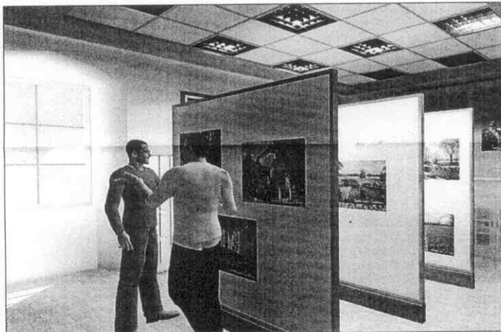
Vizualizace interiéru budoucího muzea.

V nově zrekonstruovaných prostorách by měla po přestavbě vzniknout stálá muzejní expozice. Muzeum Častolovic by se mělo stát multifunkčním, multižánrovým a variabilním místem, kde se budou střetávat zástupci všech generací, uskutečňovat různé besedy, přednášky, výstavy, koncerty a videoprojekce. Zároveň bude prostor nadále sloužit i jako volně přístupná, tudíž je nutné zajistit mobilitu výstavních ploch a exponátů. Při pořádání tematických výstav většího rozsahu je možné využít i sousední zasedací místnost a chodbu před Úřadem městyse Častolovic.