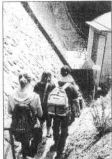
Žáci sestoupili po přehradě.