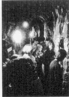
Temné chodby v přehradě.